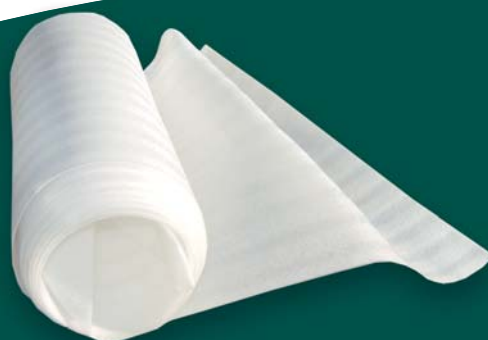
MANTA BAJO PISO