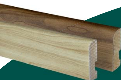
ZÓCALOS DISEÑO TOP FLOOR